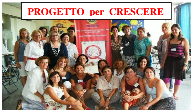
PROGETTO per CRESCERE